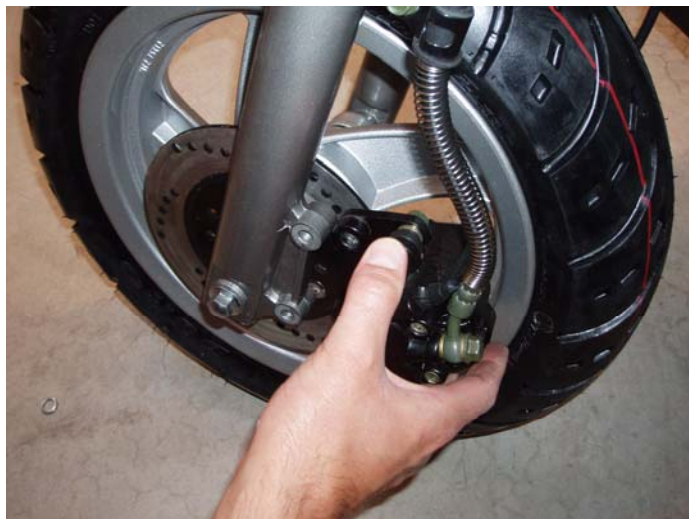
Montera tillbaka bromsoket #12 nyckel.

Montera pakethållare och täck bultskallarna med bifogade gummihattar.