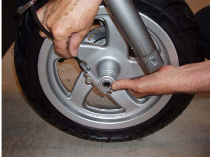
Montera hastighetsmätarens drevhus

Montera och dra fast framaxeln. Montera ett gummiskydd på bulten och ett på muttern.